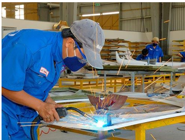
(ảnh minh họa)